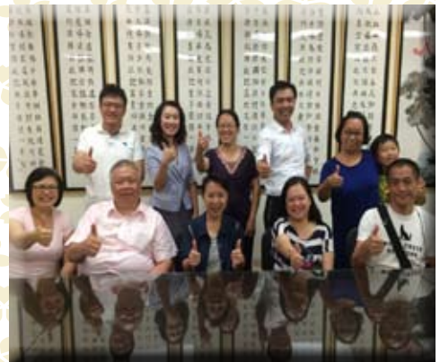
評審和志工的大合影

『孝協』志工們餐敘，討論八月一日影音頒獎典禮的工作分配及負責內容，為了讓當天的頒獎活動順利進行，各組工作人員對自己的工作內容充分了解，期許活動當天能提供給來賓最好的服務。