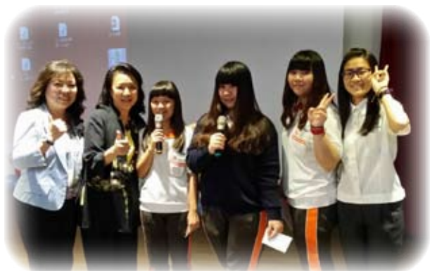
與景文高中孝親感恩的主持群合影