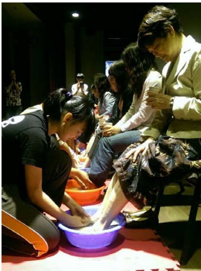
景文高中孝親感恩，同學奉茶給家長，並幫家長洗腳