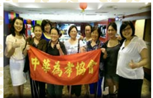
8月1日頒獎活動的志工大合影