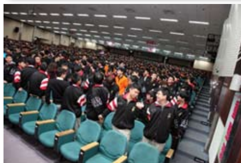
大安高工參與講座的同學們