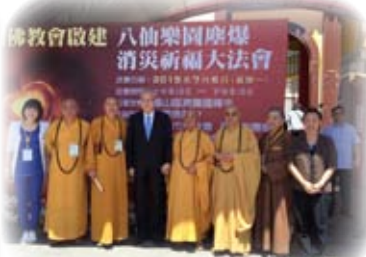
圓山臨濟護國禪寺舉辦的八仙樂園塵爆消災祈福大法會大合影