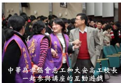
中華為孝協會志工和大安高工校長一起參與講座的互動遊戲