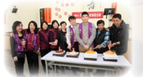
為1、2月的壽星們舉行慶生會

活動中也為1、2月的壽星們舉行慶生會，由壽星們一同切蛋糕慶生，在大家一起熱鬧歡唱的氣氛下，活動圓滿結束。