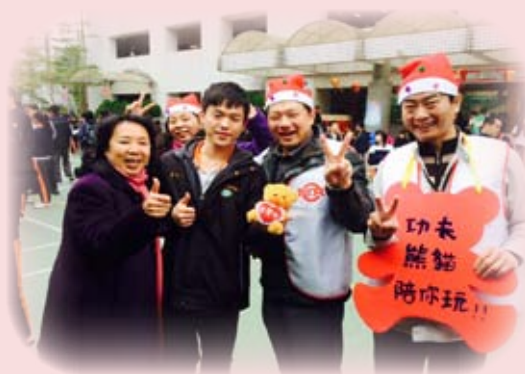
景文高中校慶園遊會