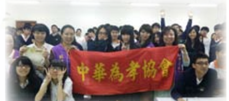
景文高中參與講座的同學們大合影