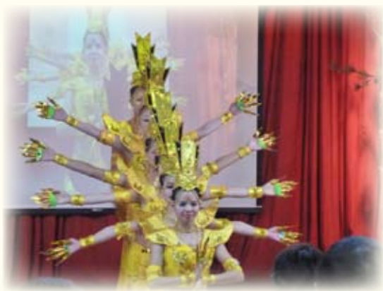
參加淨耀大和尚壽誕