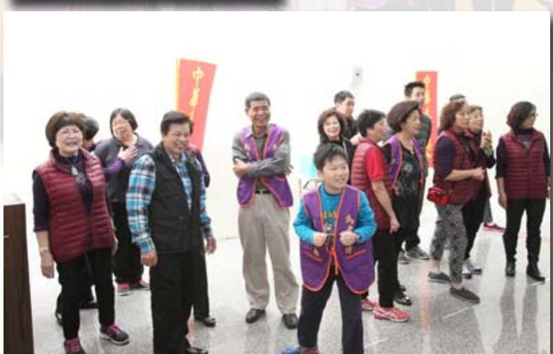
默契十足闖關遊戲，為了得到分數，大家表情都很緊張喔！