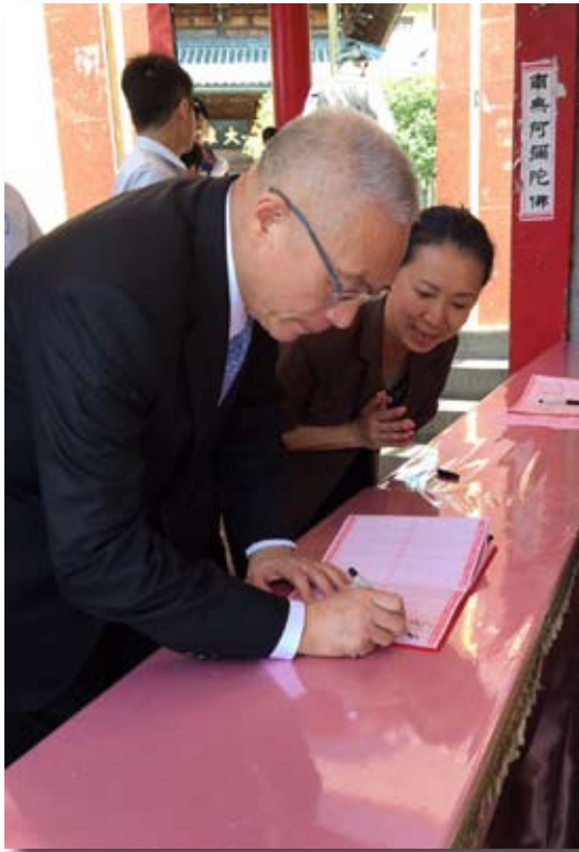
圓山臨濟護國禪寺舉辦的八仙樂園塵爆消災祈福大法會，於會場遇吳敦義副總統。