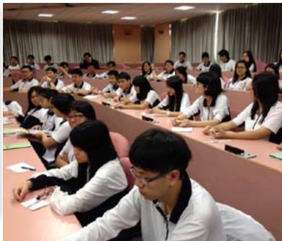
祐德高中參與講座的同學們