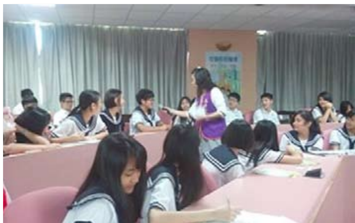
祐德高中參與講座的同學們