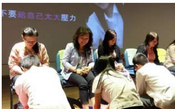
景文高中孝親感恩暨成年禮洗腳儀式

2015.4.24協辦景文高中孝親感恩合唱比賽，為弘揚孝道，喚醒同學們對長輩要懂得表達感謝之意，藉由『孝協』影音的播放，喚起同學們對身邊長輩的重視和珍惜。會中透過幫長輩洗腳、按摩和擁抱，增進親子間的距離，『孝協』提供天然的花草浴鹽讓長輩們泡腳紓壓。