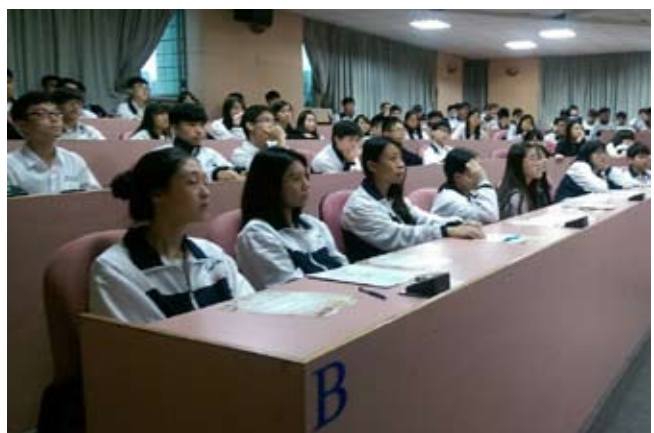
協和祐德高中參加講座的同學們專注的觀看影片