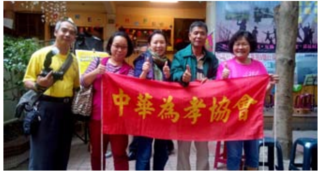
參加蘆荻社大社區營造成果展暨社區同樂會

104、11、01活動結合環保概念，設有闖關遊戲，有『綠色經濟』、『社區風景』、『主題特色』、『記憶的廚房』、『呷安心～友善小農市集』五大區，共16個特色攤位，並有吉他演奏表演，十分熱鬧。