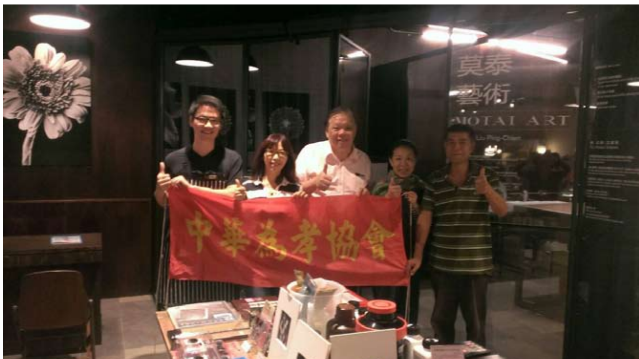
拜訪劉秉儉大師工作室