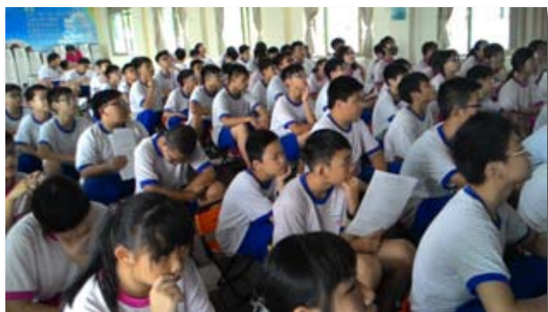
蘭州國中參加講座的同學們專注的觀看影片