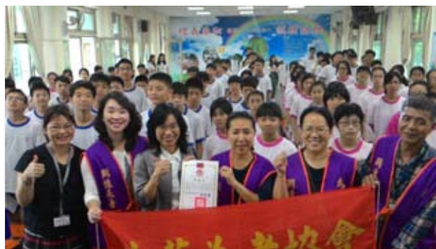
與蘭州國中同學們合影