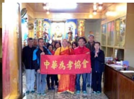
拜訪三峽六化地藏寺上惟下地法師