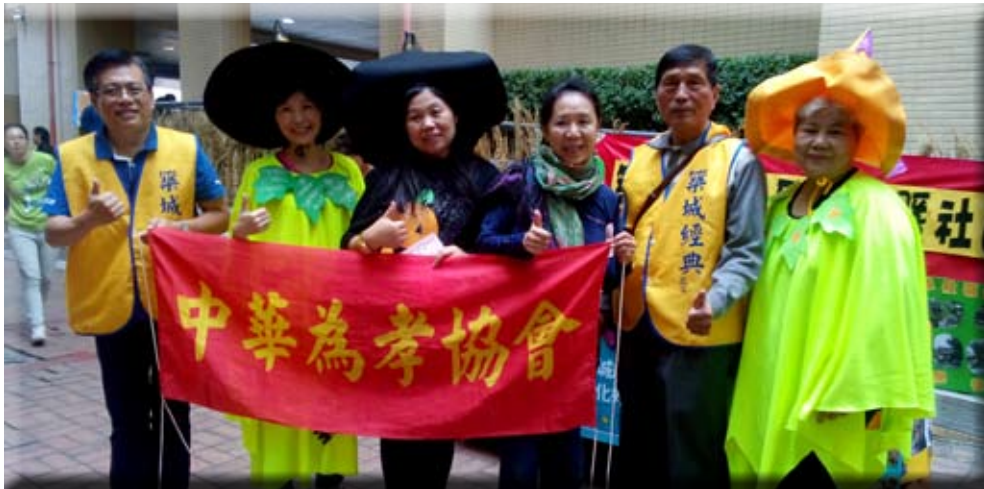
與築城經典的社區志工們合照