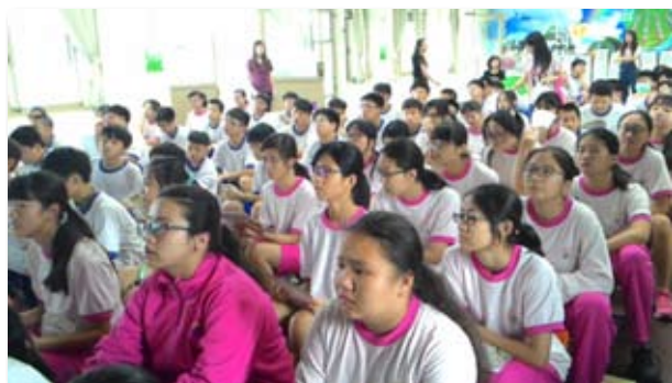
蘭州國中參加講座的同學們專注的觀看影片