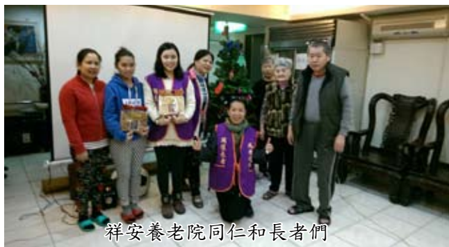
祥安養老院同仁和長者們

104、12、18陪伴長者們提前歡度"聖誕節"，一起歡樂感受過聖誕節的溫馨氣氛。