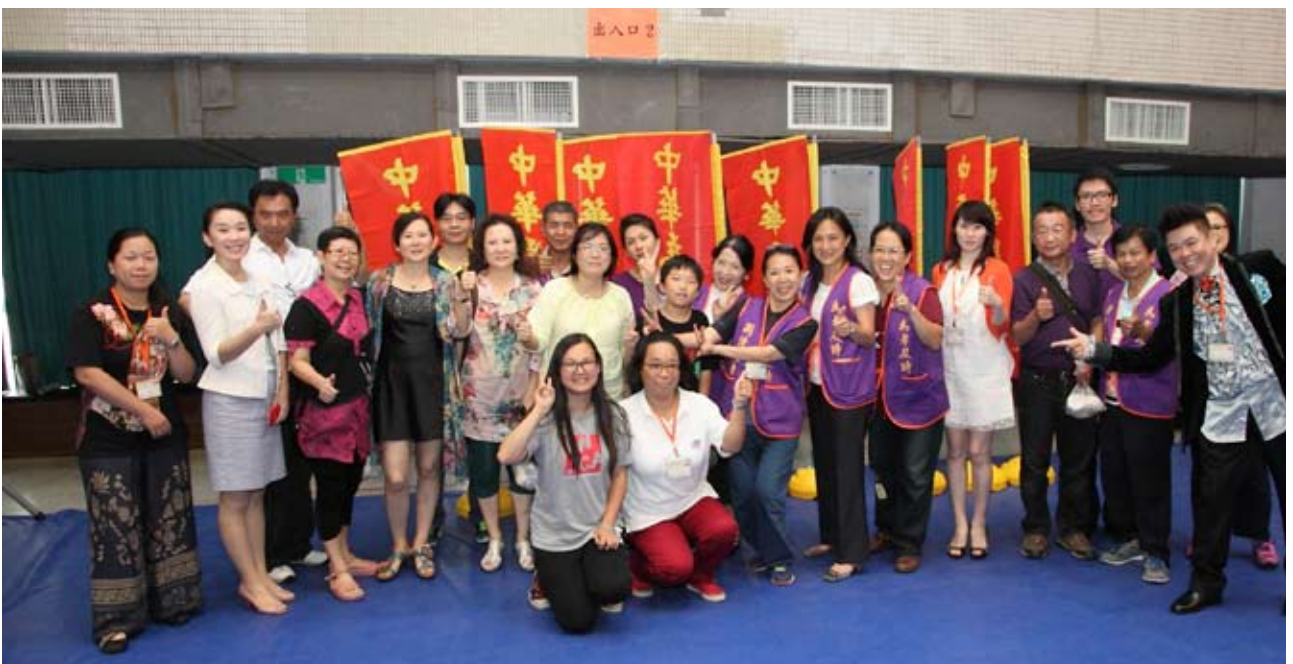
中華為孝協會志工群