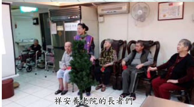
祥安養老院的長者們