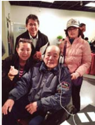
與參觀展覽的長者合影