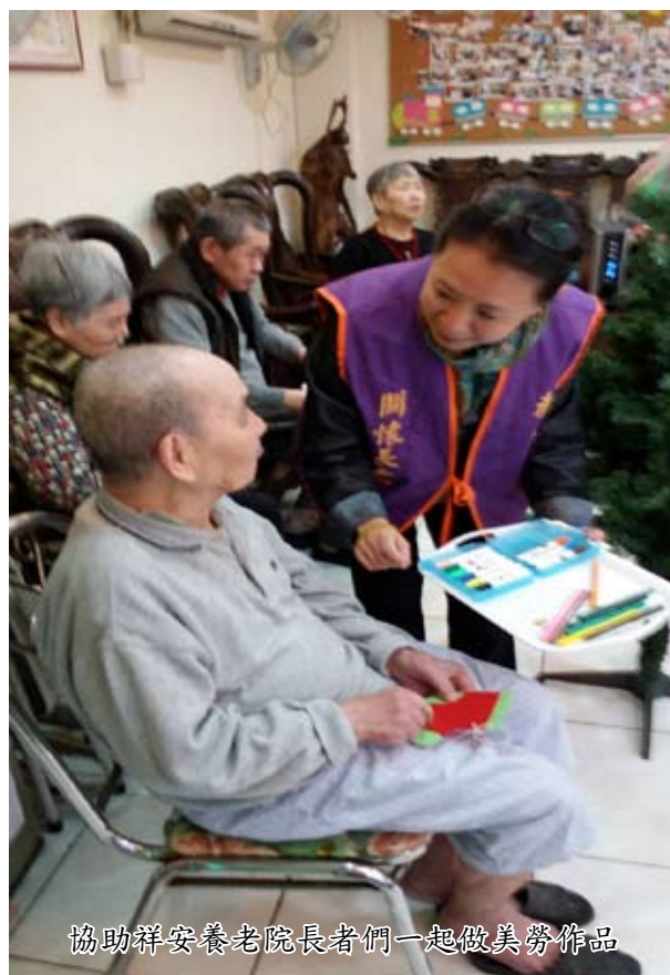
協助祥安養老院長者們一起做美勞作品