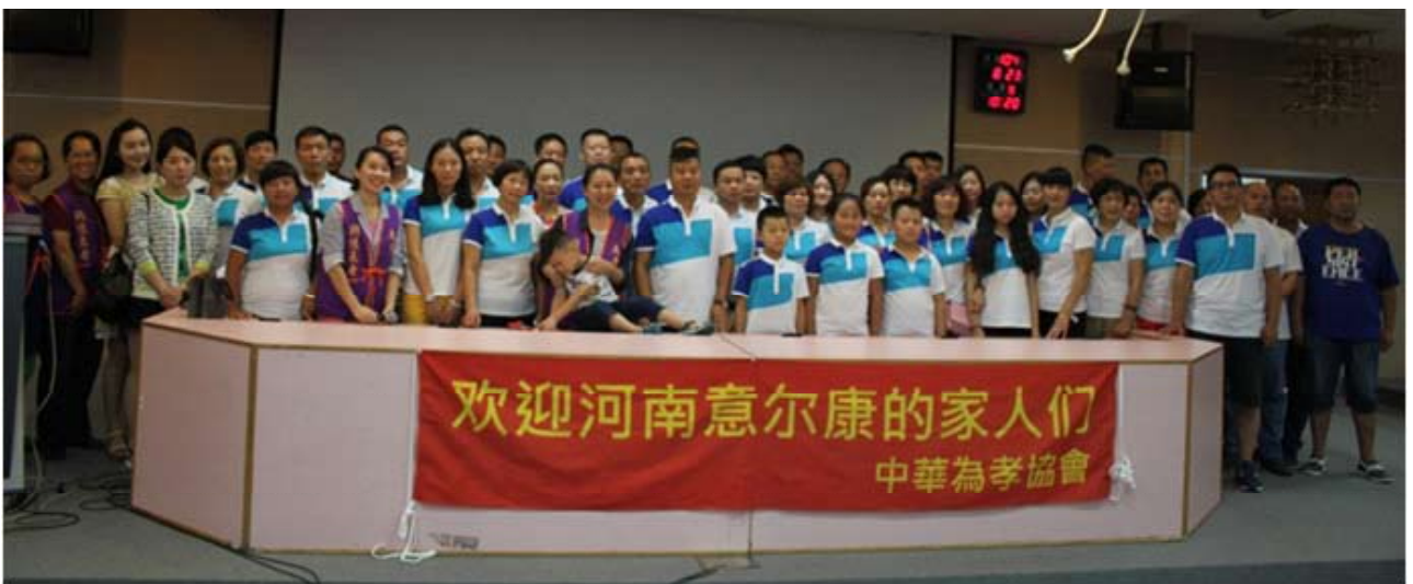
河南省意爾康的家人們大合照