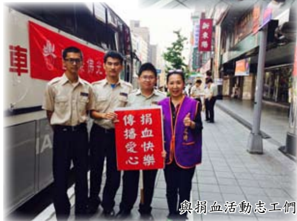
與捐血活動志工們合影