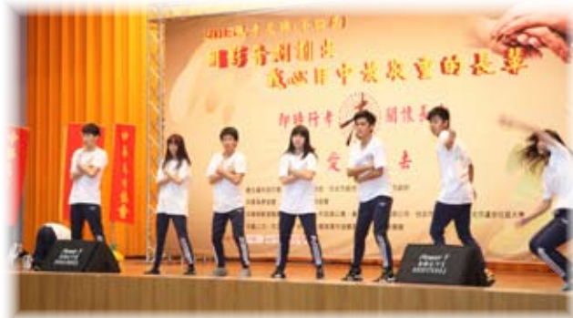
景文高中熱舞社同學表演

中華為孝協會創會理事長蘇慧倫，曾是30年前演”星星知我心”的小童星—佩佩，目前在美國律師事務所—加州矽谷執業，為海峽兩岸提供智慧財產權及相關法律服務，2014年4月蘇慧倫理事長榮獲『矽谷商業週刊百位具影響力的女性』之一。