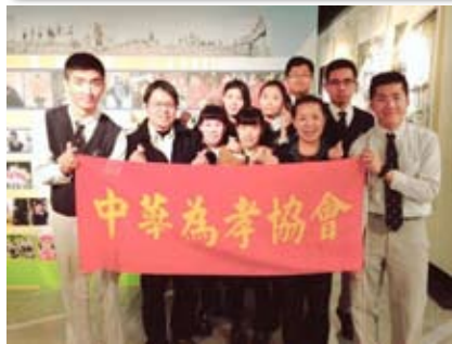
與新竹忠信高中同學合影