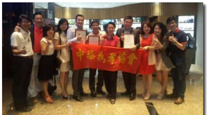
瑞光扶輪社的好友們