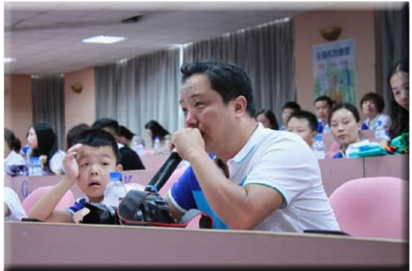
河南省意爾康的家人們參加講座深受感動