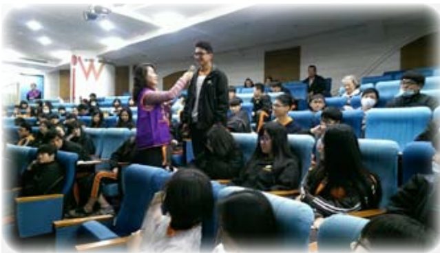
講座中與同學的互動