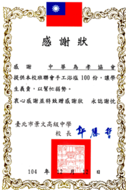
景文高中致贈感謝狀